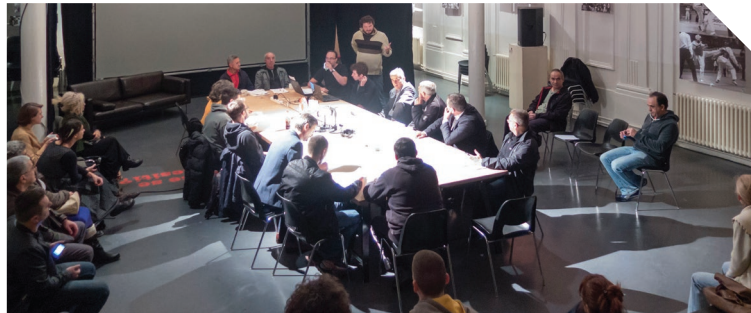
Imenovati TO ratom

Riliten uciteljneznalica.org društvena pitanja