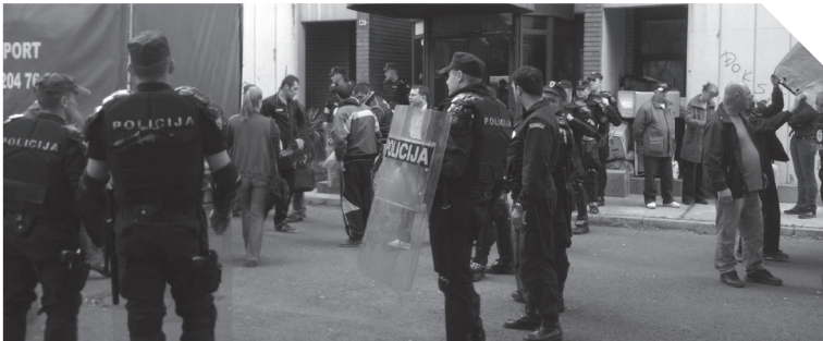
Imenovati TO ratom

Ri l t e n uciteljnezalica.org društvena pitanja