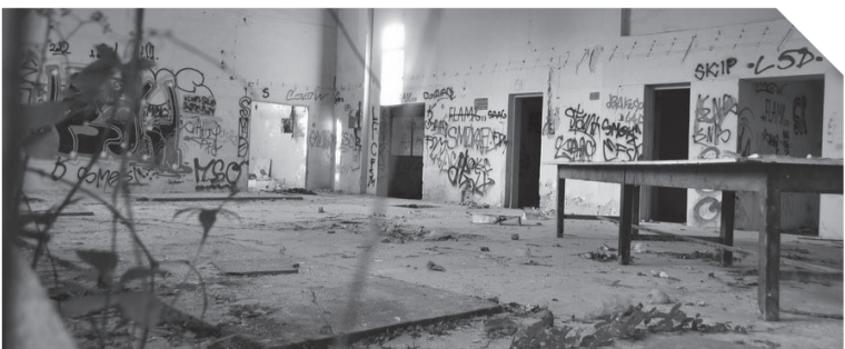
Imenovati TO ratom

Nadzorni odbor, između ostalog, utvrđuje poslovnu strategiju i poslovne ciljeve društva i nadzire njihovo ostvarivanje, to jest nadzire rad izvršnih direktora. S druge strane, izvršni direk-