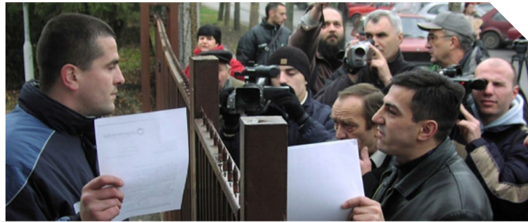
Imenovati TO ratom

Ponedeljak 16. mart 2015. godine u 17.00h