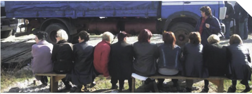
Imenovati TO ratom

Riliten uciteljneznalica.org društvena pitanja