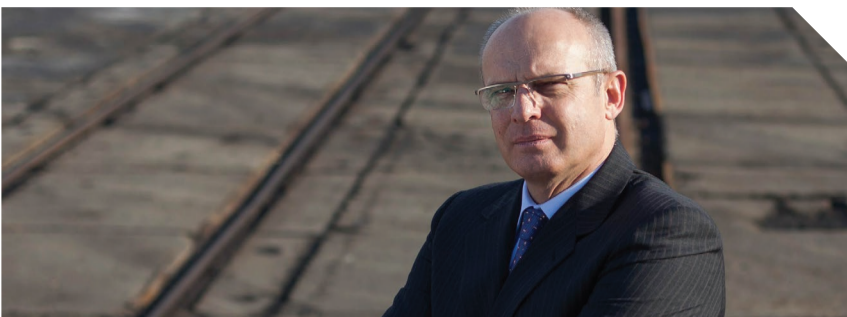
Imenovati TO ratom

Република Србија ПРИВРЕДНИ СУД У БЕОГРАДУ VII-Су број:171/14 25.07.2014. године Београд