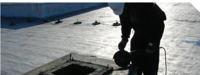
Imenovati TO ratom

Posle pet dana potpune obustave rada, čime su advokati pokazali jedinstvenost, protest upozorenja nije imao očekivane rezultate, tako da je dana 22. juna 2014. godine i Skupština Advokatske komore Srbije donela odluku o trodnevnoj potpunoj obustavi rada advokata počev od srede 25. juna 2014. do petka 27. juna 2014. godine, na koji način se cela advokatura Srbije pridružila nastavljenom protestu advokata Beograda. Nakon što su se protestu pridružili advokati iz cele Srbije, AK Beograda je donela odluku dana 27. juna 2014. godine da se protest advokata Beograda nastavlja do daljnjeg s obzirom da na sastanku sa ministrom pravde nije postignut dogovor o usvajanju traženih zahteva. Tek 2. jula 2014. godine