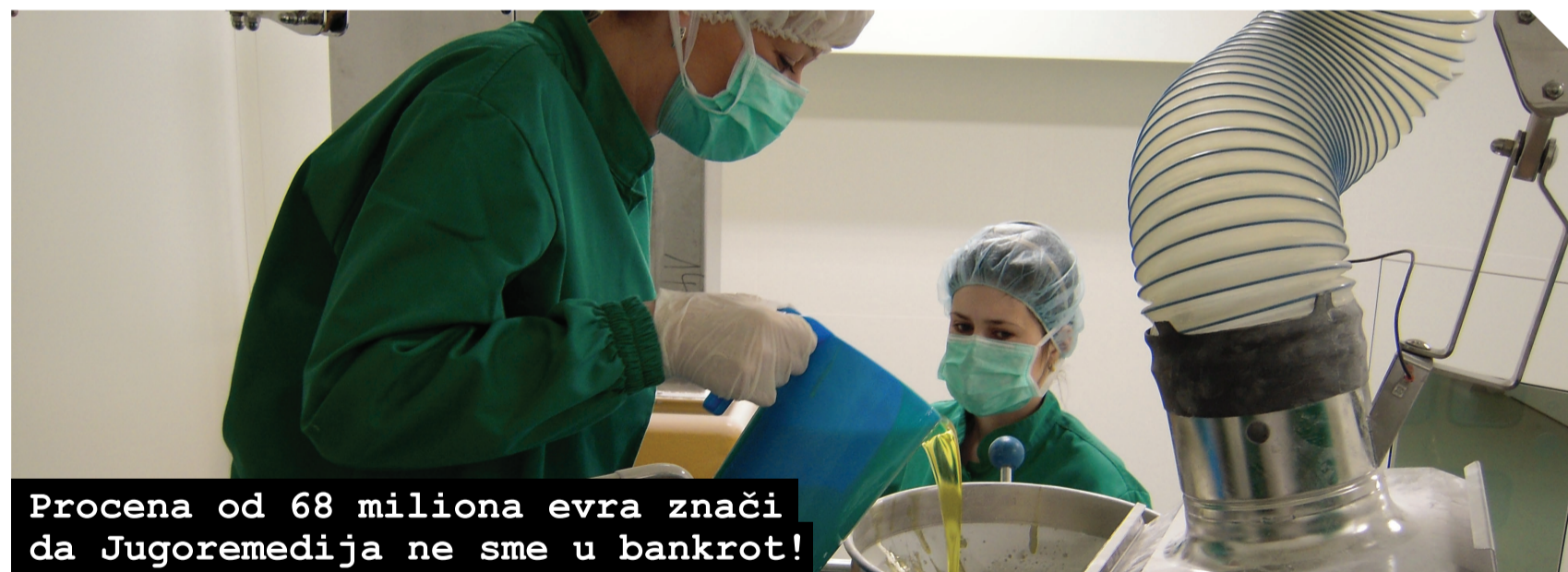
Procena od 68 miliona evra znači da Jugoremedija ne sme u bankrot!