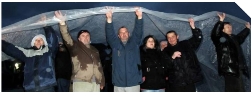
Imenovati TO ratom

Važno je napomenuti, da Zakon o ustavnom sudu eksplicitno ne predviđa postupak ocene ustavnosti i zakonitosti načina i postupka na koji su usvojeni predlozi zakona, odnosno radnje državnog organa koji učestvuju u proceduri donošenja zakona, tako da se često dešava da se Zakoni i drugi opšti pravni akti donose u neustavnoj proceduri i da kao takvi kasnije egzistiraju u pravnom životu, bez efikasnog pravnog sredstva koje bi sprečilo njihovu egzistenciju.