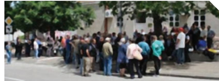
Imenovati TO ratom