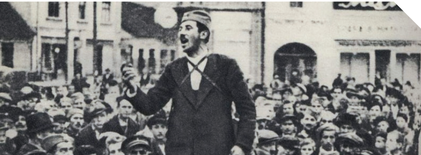
Imenovati TO ratom – Centar za kulturnu dekontaminaciju

Decembra 2012. godine savez udruženja građana PARISS (Pokret akcionara, radnika i sindikata Srbije) pokrenuo je inicijativu za ocenu ustavnosti Zakona o privatizaciji i restituciju društvene svojine nekadašnjim radnicima društvenih preduzeća. Ustav Srbije koji je bio na snazi u vreme donošenja Zakona o privatizaciji 2001. godine, štiti je društvenu svojinu ravnopravno sa drugim