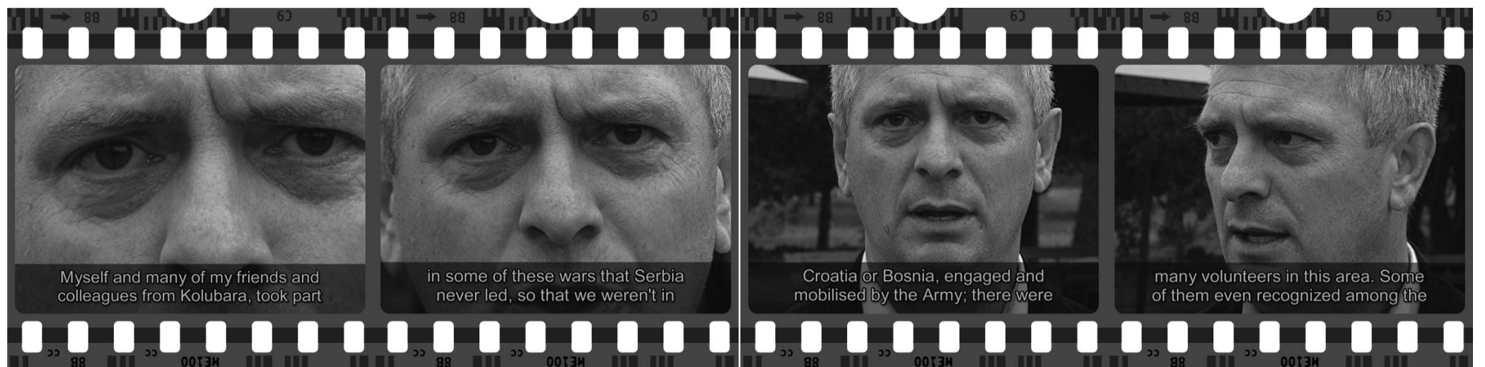
Myself and many of my friends and colleagues from Kolubara, took part